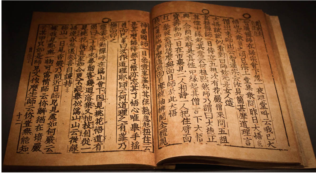
Figure 1.2: The oldest extant book printed with movable type, Goryeo Dynasty, Korea.

mauris odio placerat metus, vel scelerisque dui nulla sit amet est. In eleifend porttitor turpis, ut placerat nunc volutpat vel. Quisque facilisis justo massa, id imperdiet justo mollis quis. Mauris gravida turpis eget pulvinar pellentesque.