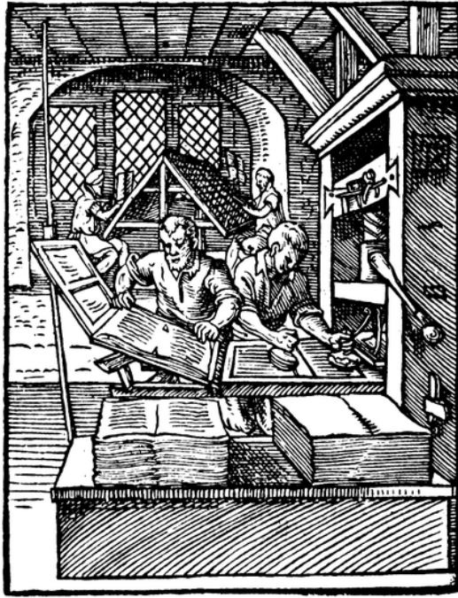
Figure 2.2: Printing Press of Johannes Gutenberg from 1439.

Praesent dictum, lacus ac vehicula tristique, nibh nunc consequat diam, at viverra